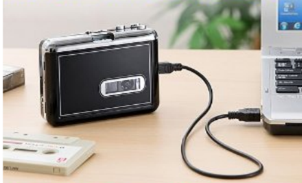
カセットテープ変換プレーヤー