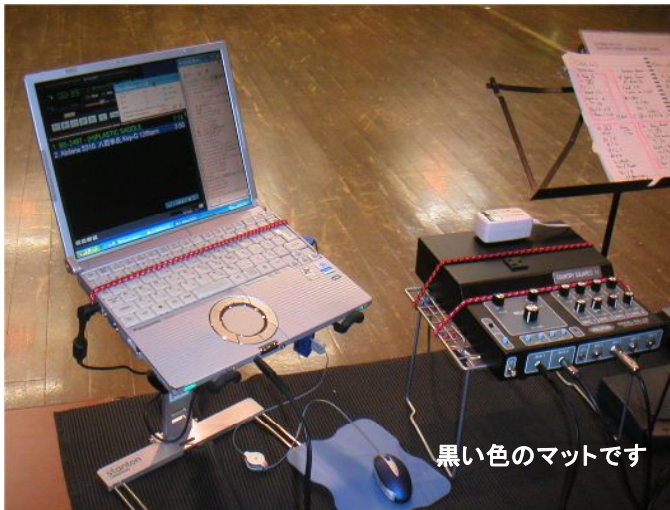
黒い色のマットです