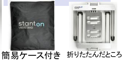
簡易ケース付き 折りたたんだところ